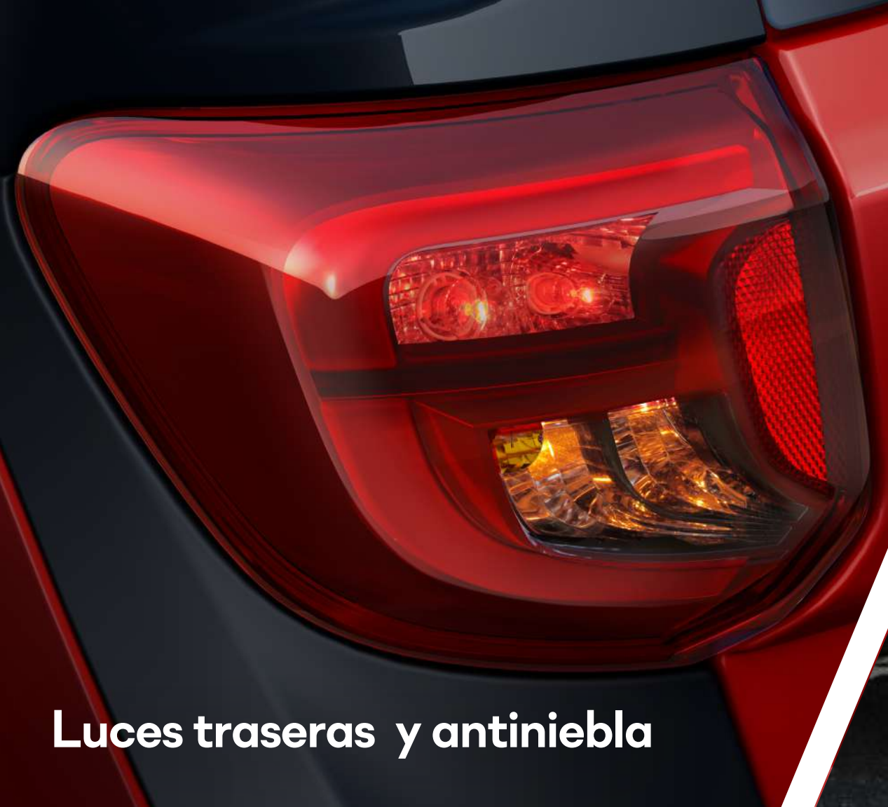
Luces traseras y antiniebla