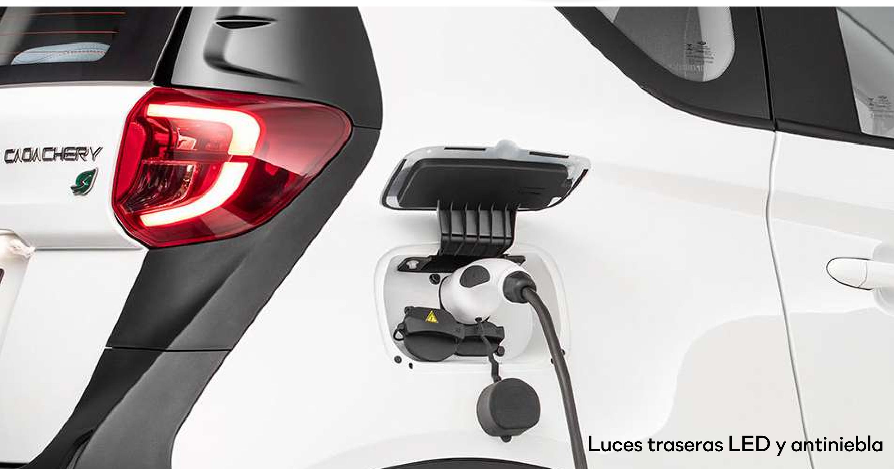
Luces traseras LED y antiniebla