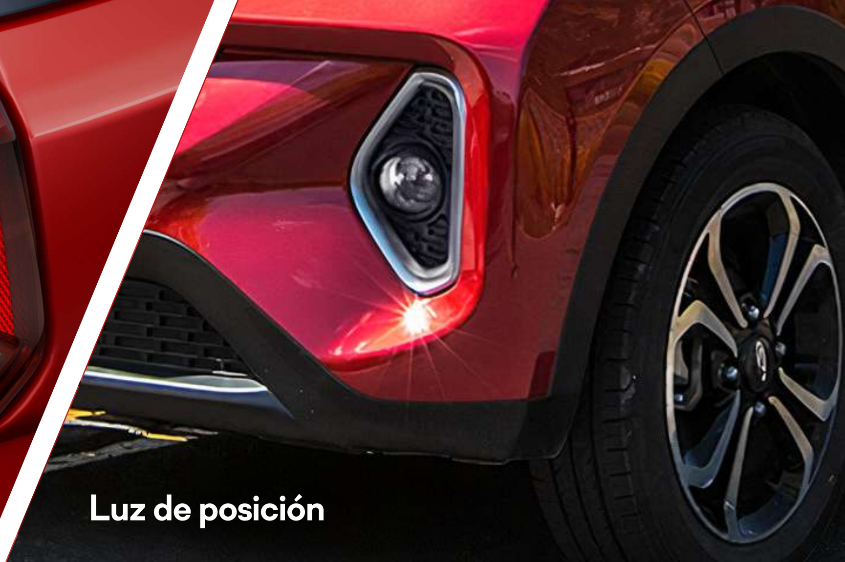
Luz de posición