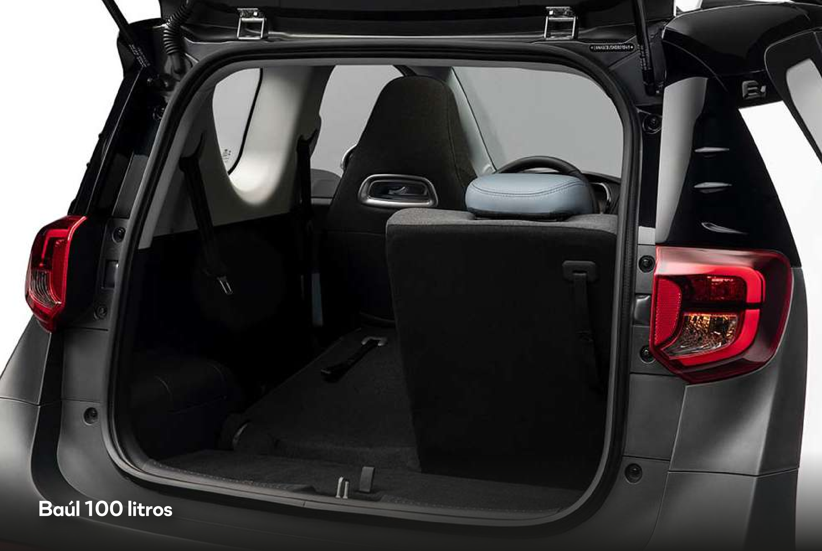
Baúl 100 litros