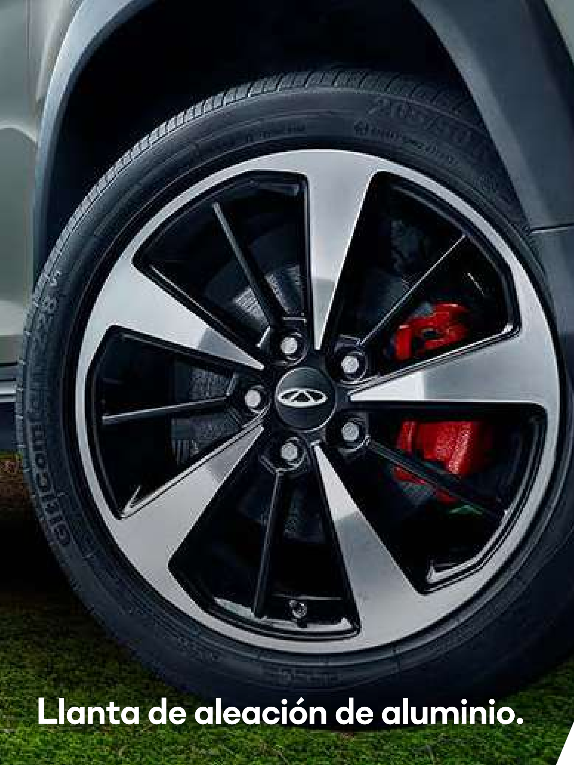
Llanta de aleación de aluminio.