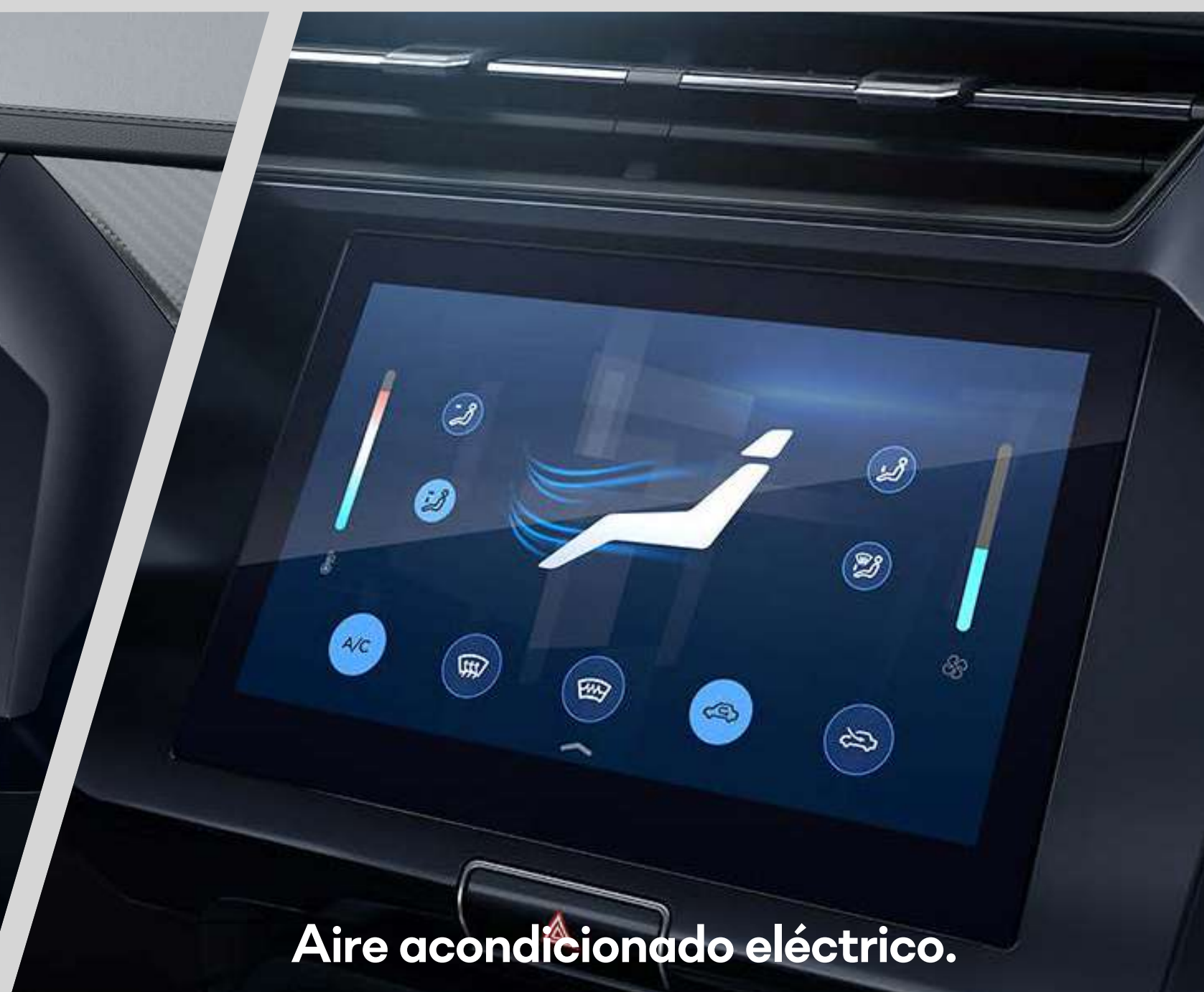
Aire acondicionado eléctrico.